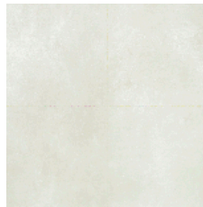
ARGENTA Porcelánico antideslizante 60x60 cm.